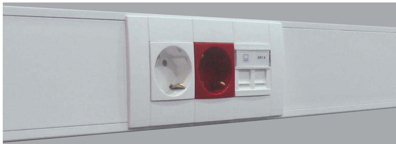
TABELA DE PREÇOS 2014/04/01